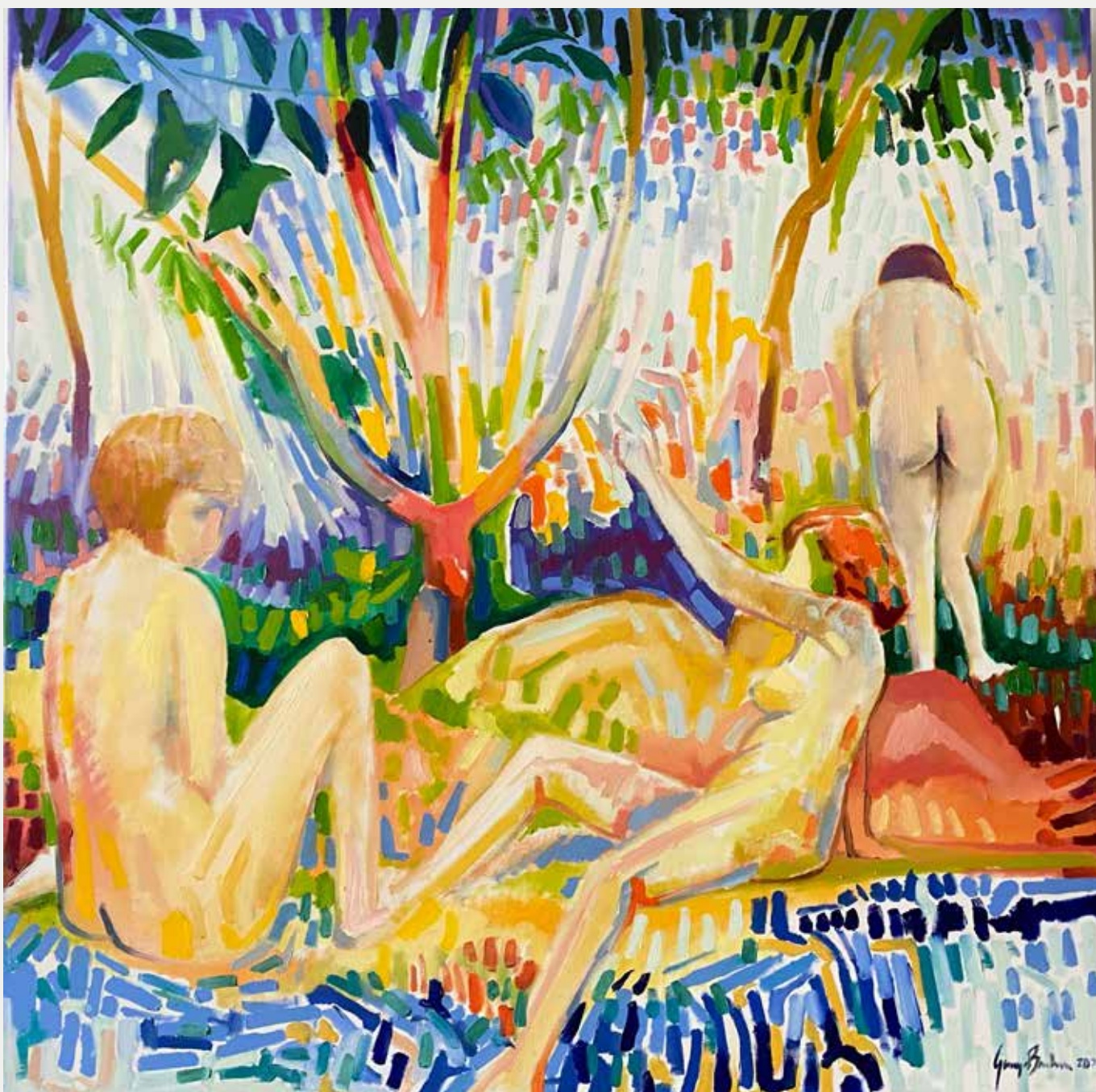
George Barbosa Banhistas Do Pina, 2021 Óleo sobre tela 100x100cm