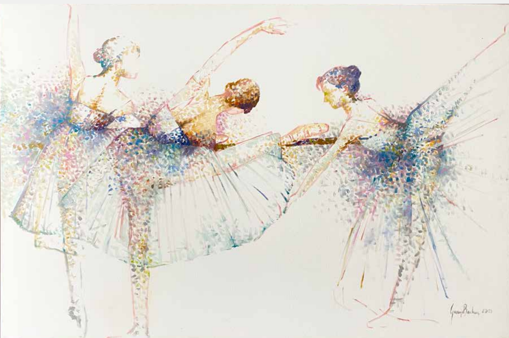
George Barbosa As Três Marias, 2021 Óleo sobre tela 80x120cm