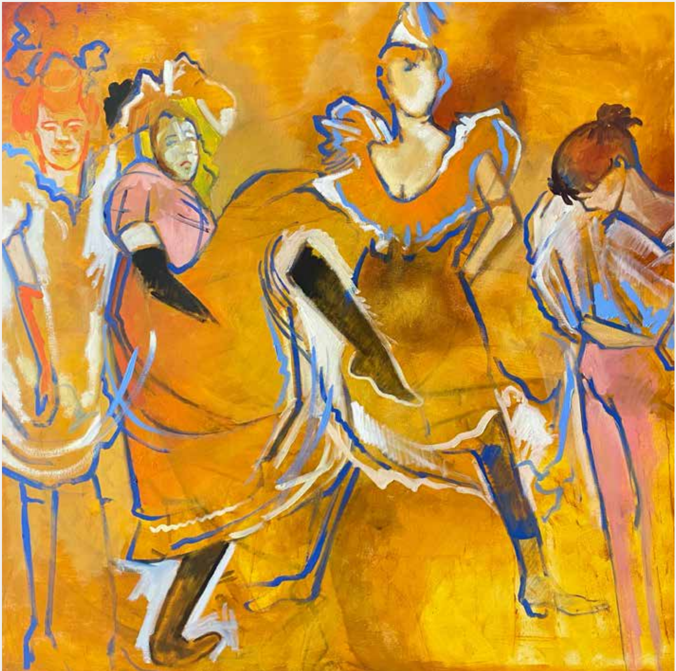
George Barbosa Cabaret Lautrec, 2021 Oléo sobre tela 100x100cm