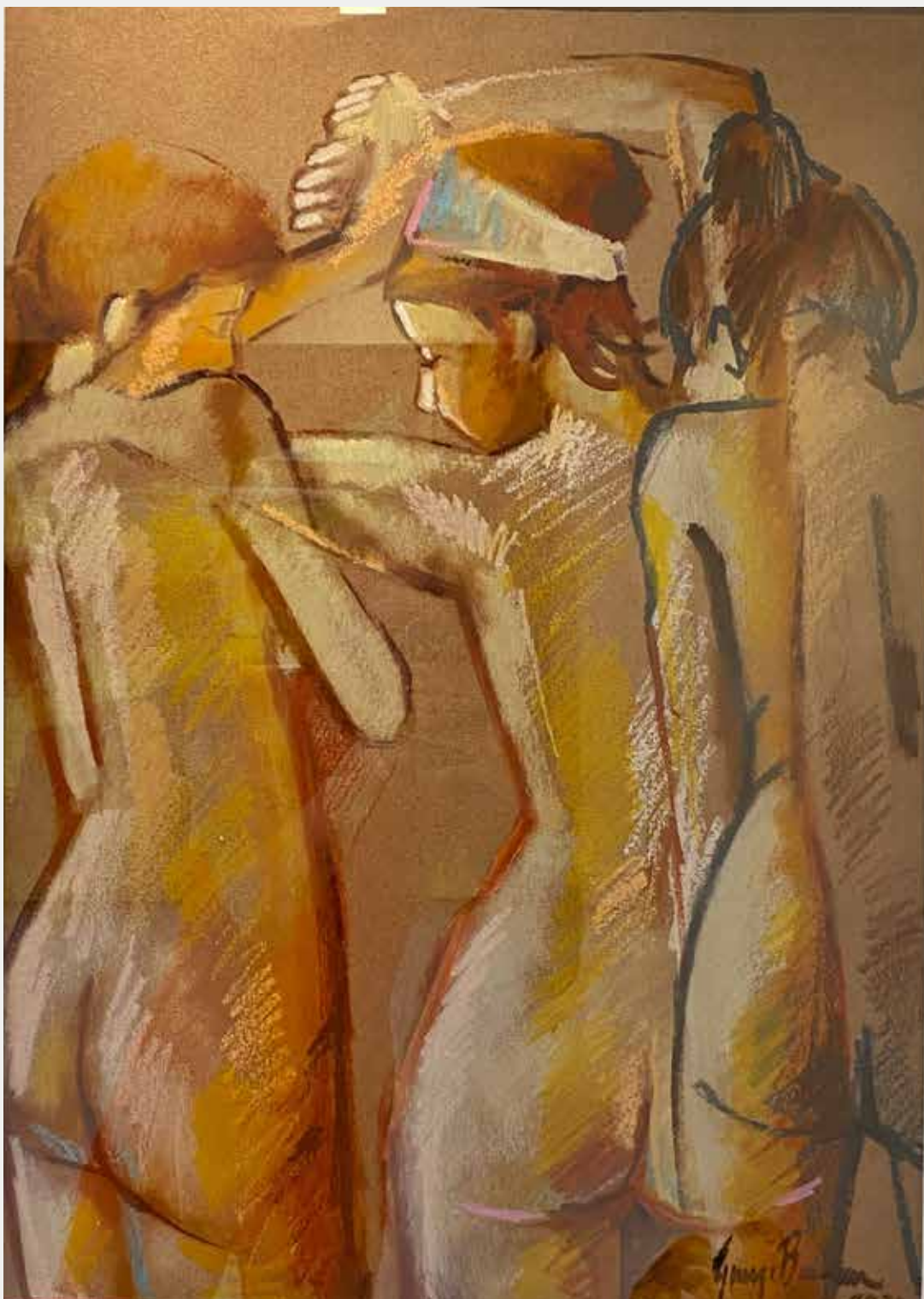
George Barbosa Intimidade, 2021 Técnica Mista 66x47cm