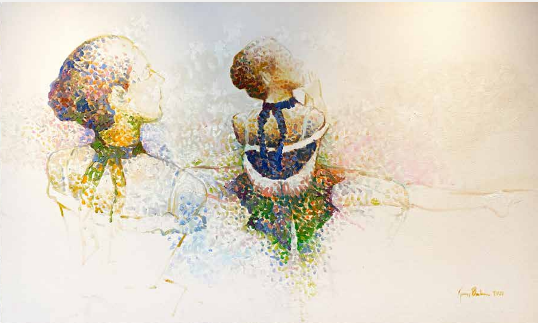
George Barbosa Será Seraut? 2021 Óleo sobre tela 60x100cm