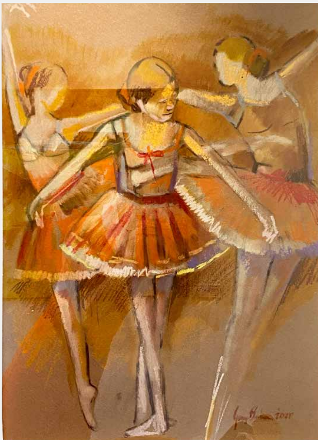
George Barbosa Primeira Aula, 2021 Técnica mista 66x47cm