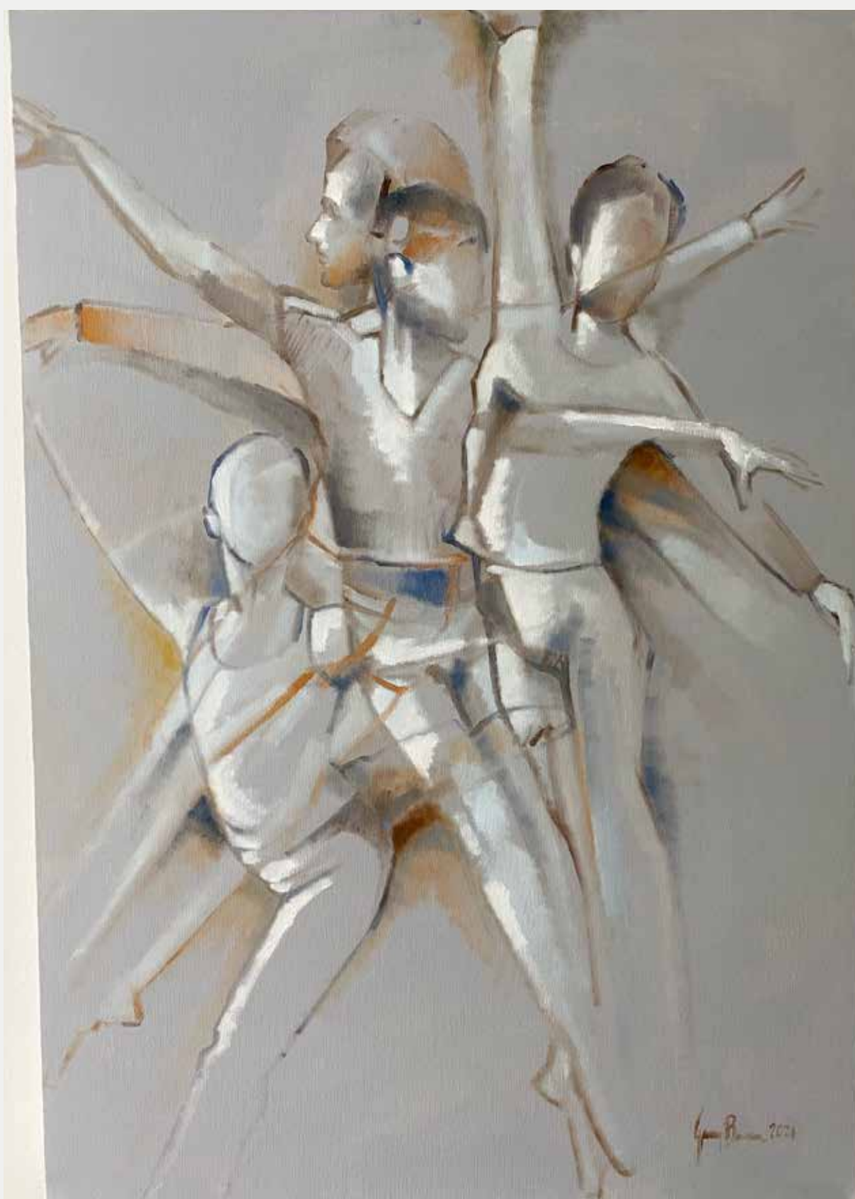
George Barbosa Gestos Em Cinza, 2021 Óleo sobre tela 100x70cm