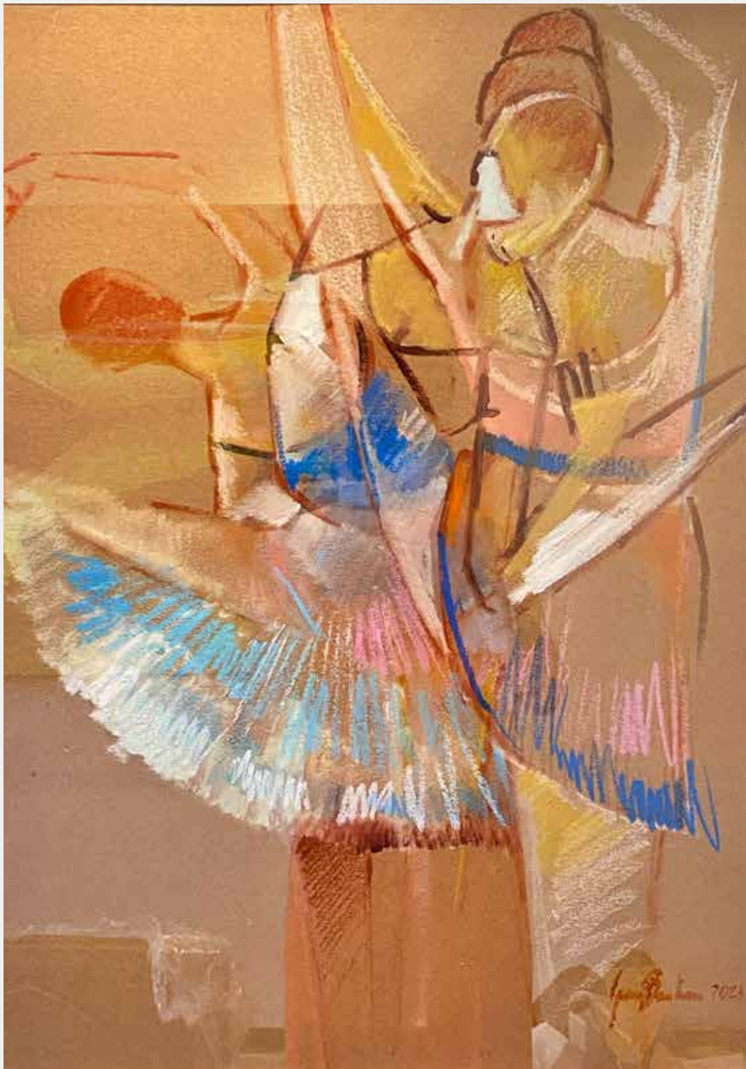
George Barbosa Aula Às Três, 2021 Técnica mista 66x47cm