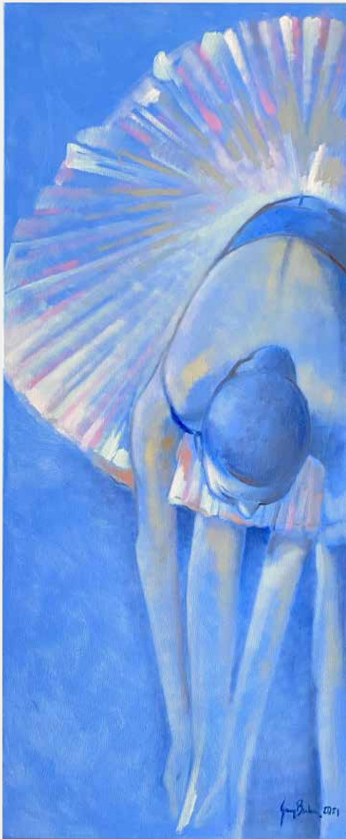
George Barbosa Ballare, 2021 Óleo sobre tela 120x50cm