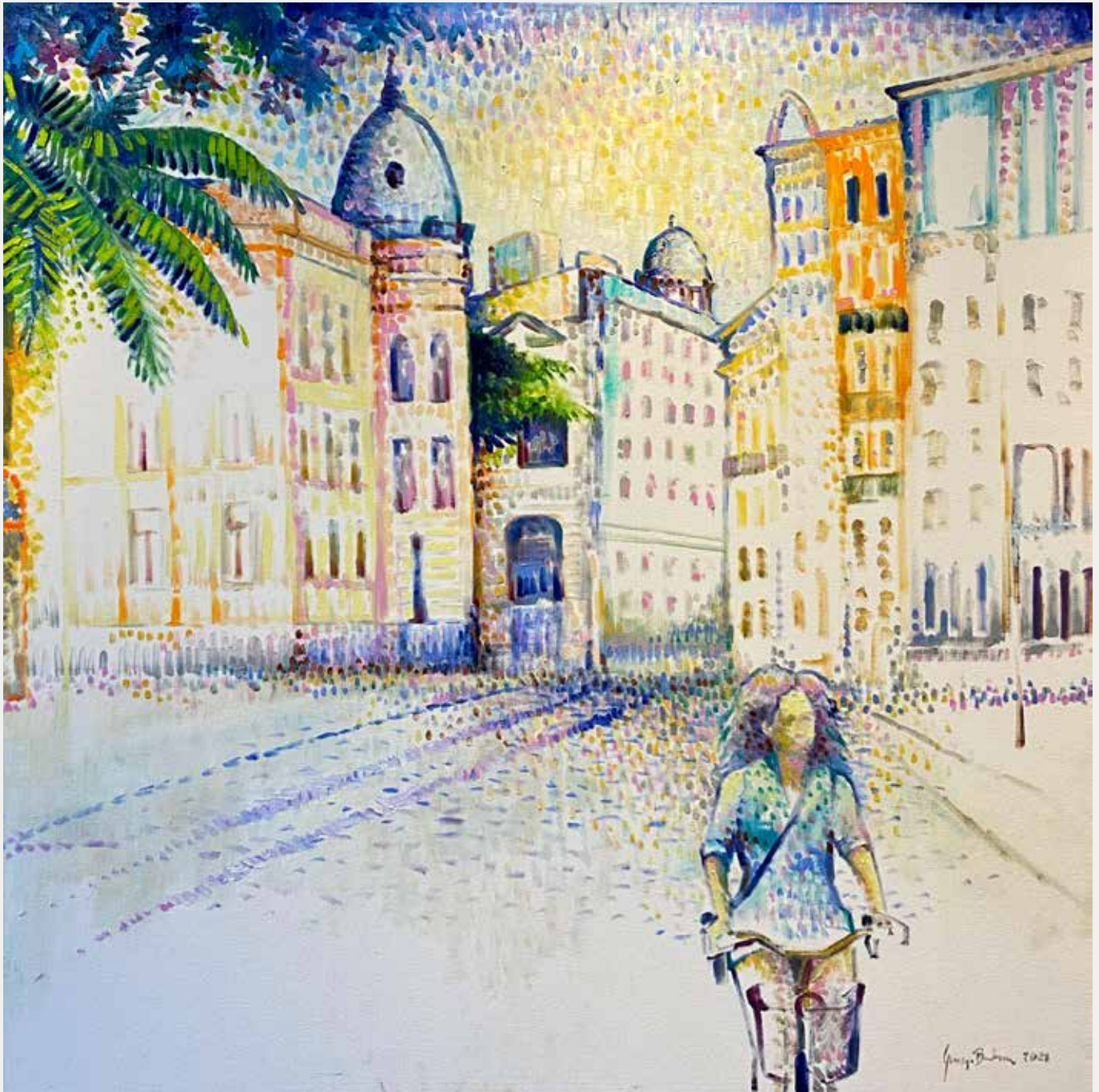
George Barbosa Recife Velho, 2021 Óleo sobre tela 100x100cm