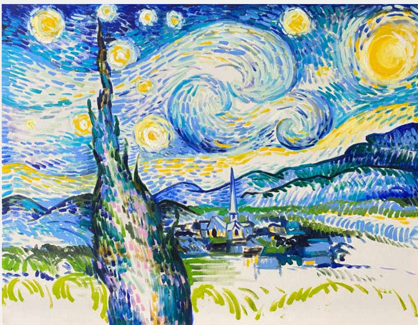
George Barbosa Noite Azulada, 2021 Óleo sobre tela 90x70cm