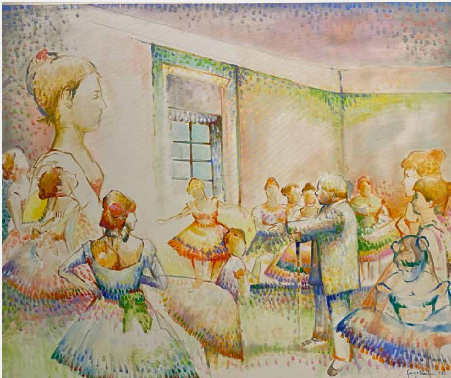
George Barbosa Aulas Com Degas, 2021 Óleo sobre tela 100x120cm