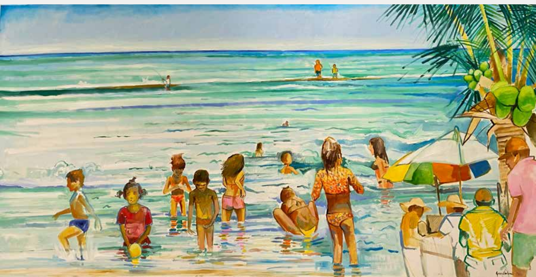
George Barbosa Atlântico I, 2021 Óleo sobre tela 110x220cm