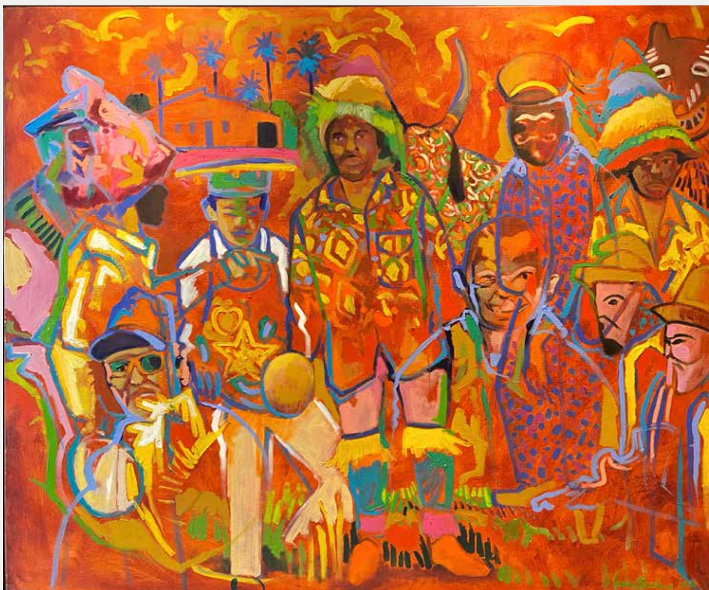
George Barbosa Cavalo Marinho, 2021 Óleo sobre tela 100x120cm