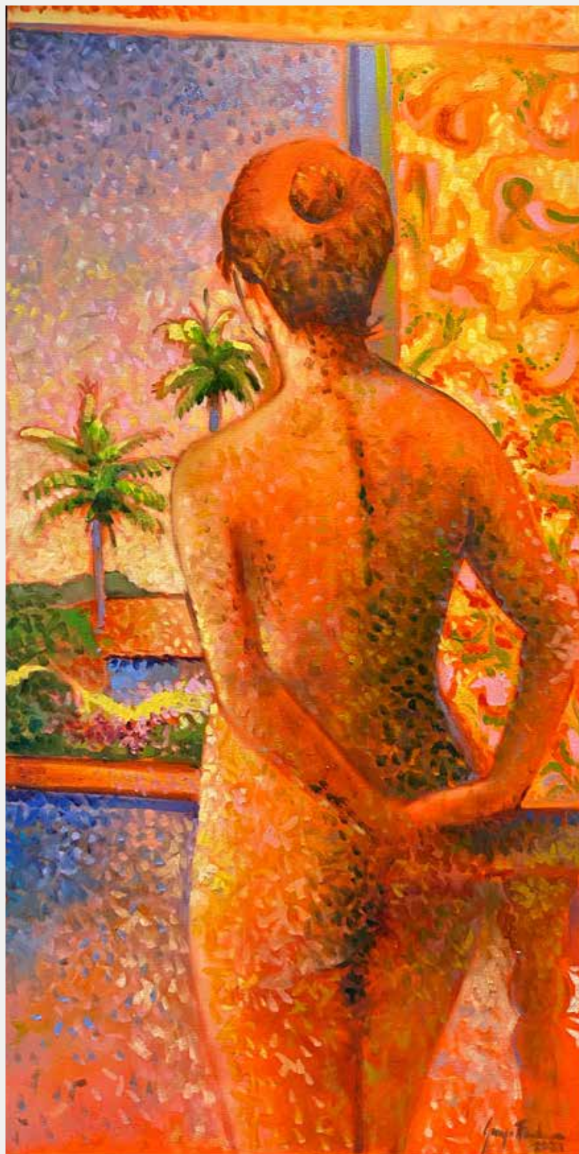
George Barbosa Brisa De Verão, 2021 Óleo sobre tela 100x50cm