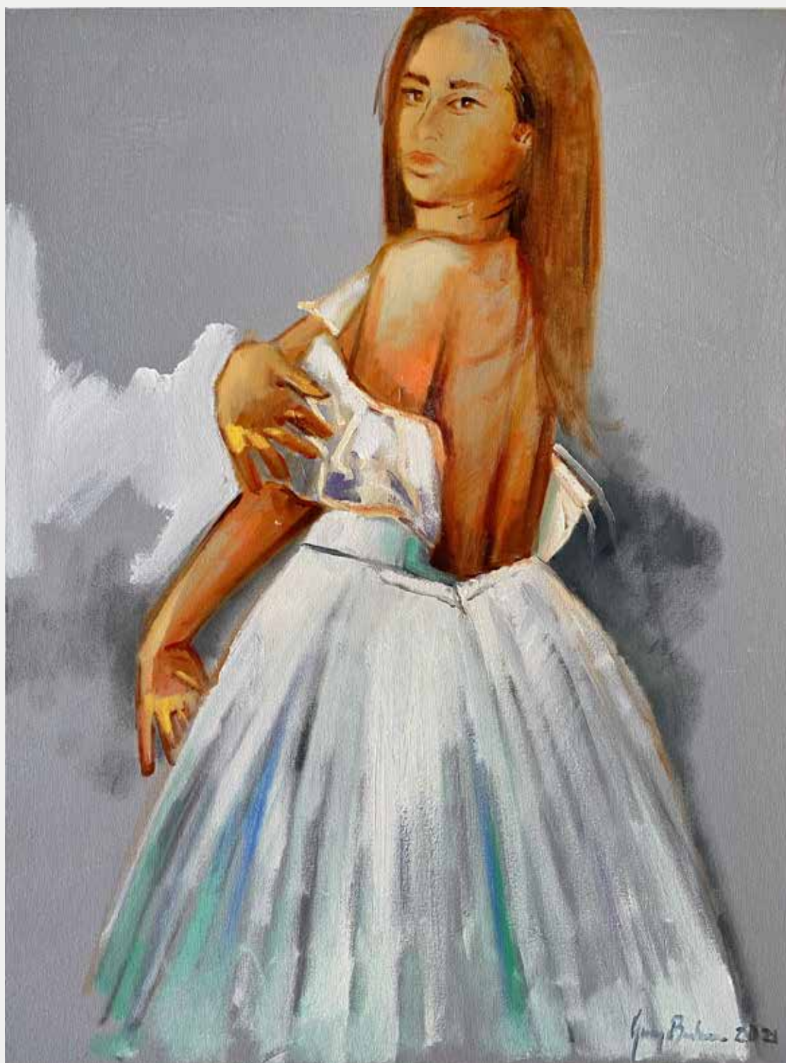
George Barbosa Vestir, 2021 Óleo sobre tela 80x60cm