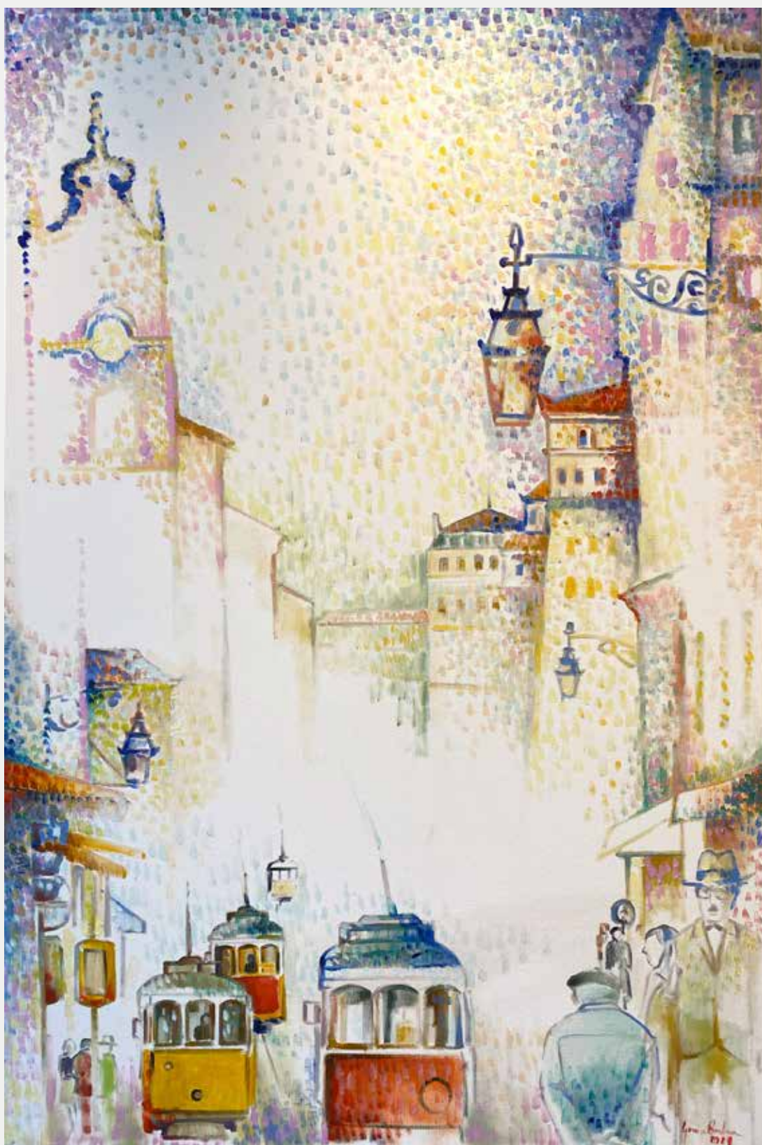
George Barbosa Velha Cidade, 2021 Óleo sobre tela 120x80cm