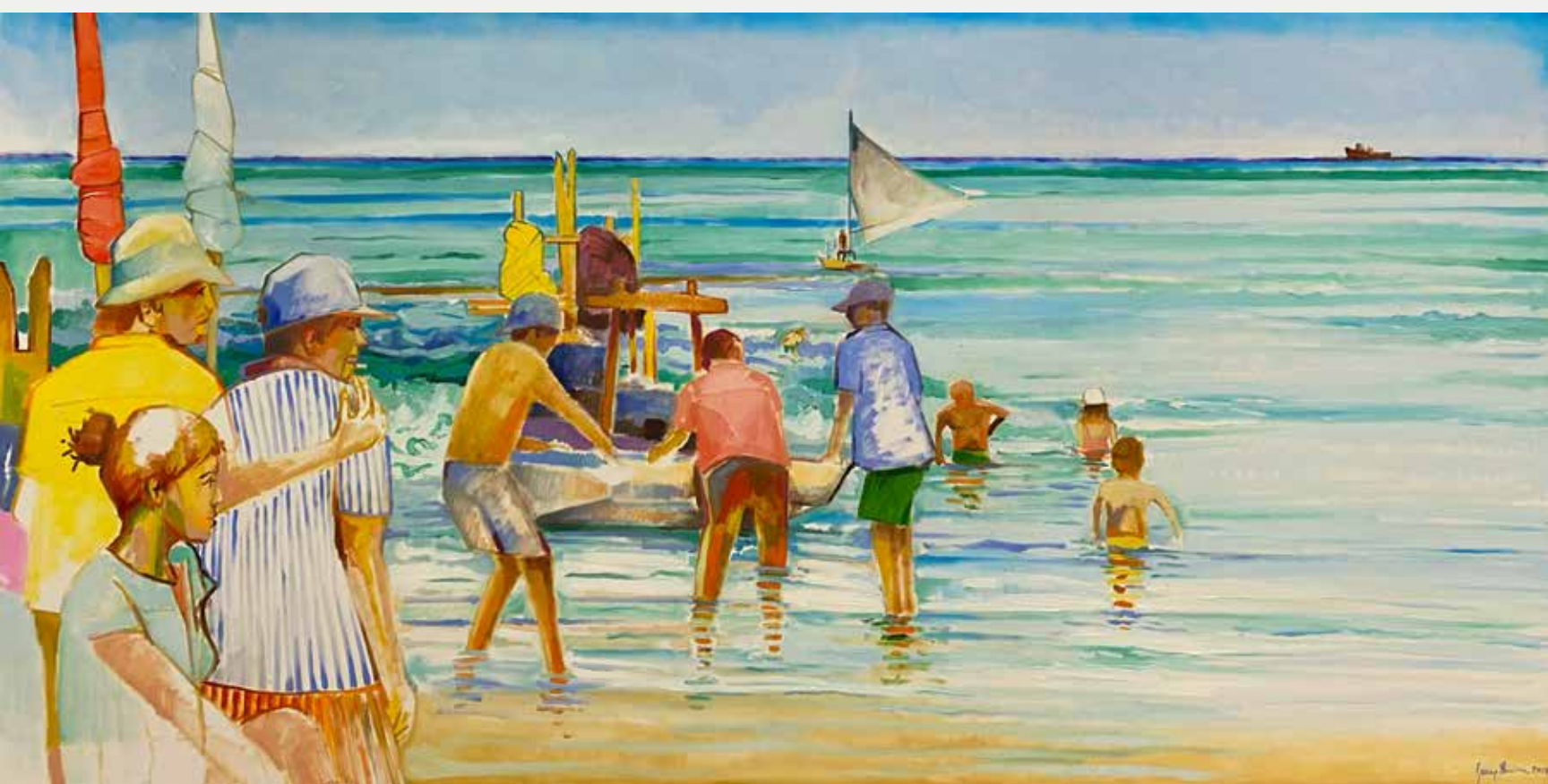
George Barbosa Atlântico II, 2021 Óleo sobre tela 110x220cm